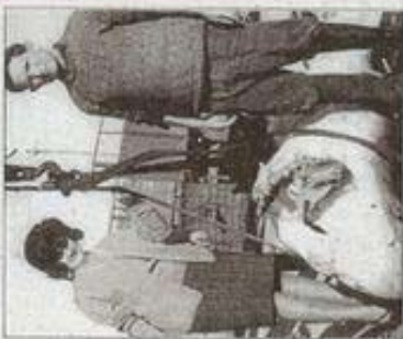
Una pareja posa junto a un escualo.

Pocas criaturas generan tanto temor como los tiburones. Sin embargo, nos sorprenderíamos si consideráramos que es más fácil sufrir un accidente doméstico que un ataque de un escualo. Los datos en Baleares hablan por sí solos. Un sólo hombre ha perecido por mordeduras de tiburón y, en cambio, 114.000 kilos de escualos han caído en manos del hombre. ¿Quién está depredando, el tiburón o el hombre?, se preguntó el productor del documental, Juan Andrés Ruiz, quien hizo hincapié en que ha sido el ser humano quien ha entrado en el hábitat de estos animales.